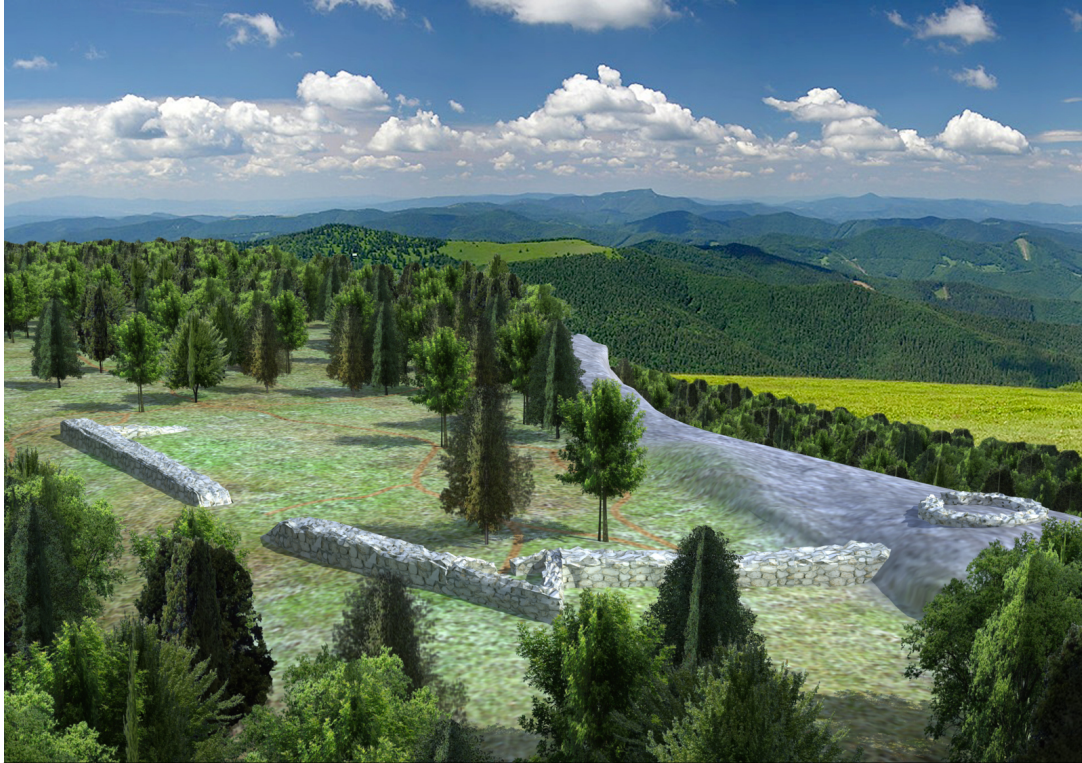
A Kassai romjai – 3D modelen Autor: Ladislav Župčán

segít a várkomplexum jobb megértésében, és megerősíti a kassai vár létezését. Ezzel véglegesen megdönti (cáfolja) az Eperjesi járásban található Szokolya/Sokol várral való azonosítását.