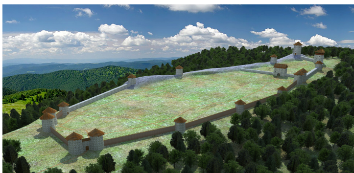
A Kassai Vár 1330 - 1335 – 3D modelen